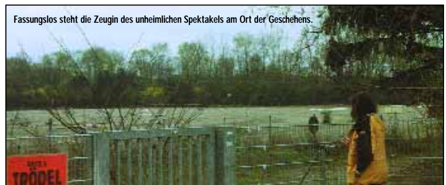
Fassungslos steht die Zeugin des unheimlichen Spektakels am Ort der Geschehens.

takt mit der Erde würde ein beträchtlicher Einfluß auf die Erdkultur geschaffen. Jedoch wenn dem Menschen künstlich, also psychotronisch, eingehämmert wird, es gibt keine UFOs oder Außerirdische, wird hiermit auch die freie Entwicklung der Art Mensch eingeschränkt. Wie kann auf diesem Nährboden eine kosmische Emanzipation der Erde innerhalb der kosmischen Völkergemeinschaft stattfinden? Es gibt nur einen Weg, hieran etwas zu verändern: sprechen wir mit ihnen. Ich denke, unser drängendes Ziel muß ein solcher Dialog sein. Wir sollten aufspringen und alle Hebel in Bewegung setzen und nicht ruhen, bevor es geschafft ist. ■