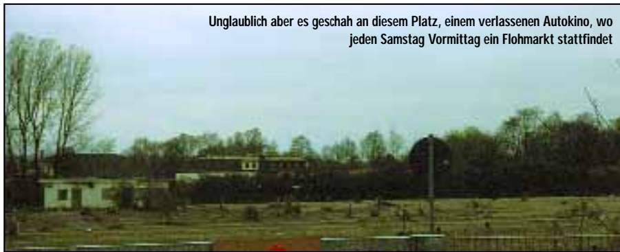
Unglaublich aber es geschah an diesem Platz, einem verlassenen Autokino, wo jeden Samstag Vormittag ein Flohmarkt stattfindet

fuhr ich nach Hause und ging gegen 3.30 Uhr zu Bett.